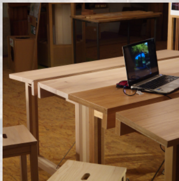
TABLE MULTI (pupitre)

Essence : Hêtre et érable champêtre pour le piétement et Hêtre et Platane pour le plateau.